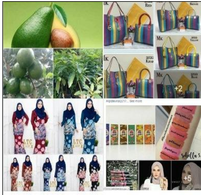
Caption : Produk Kosmetik yang dimuatnaik di laman FB & Instagram