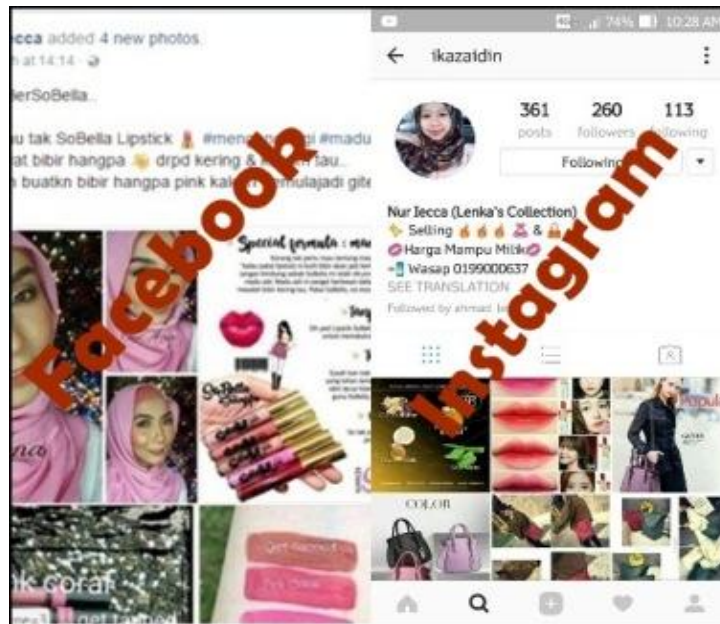
Caption : Promosi di laman Facebook dan Laman Instagram