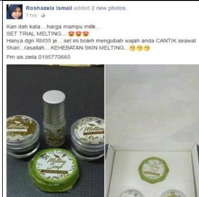
Caption : Setiap Beliau akan memuatnaik perkembangan perniagaan beliau di FB miliknya.

iv) Lain-lain (contoh : proses penghasilan produk, penglibatan dalam aktiviti lain, dsb)