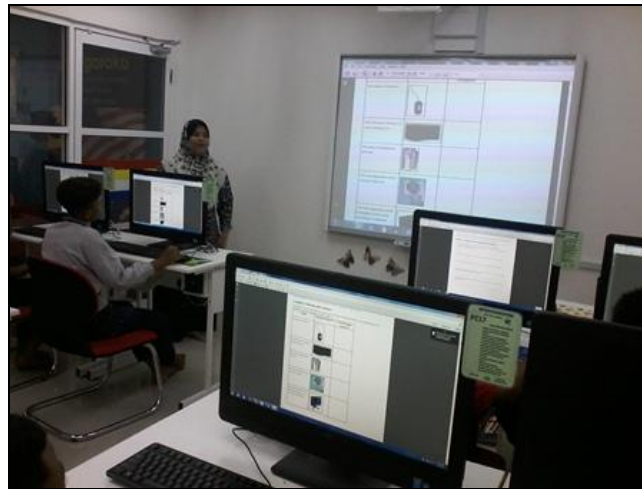
Gambar 2 - Pelajar sedang membuat latihan mengenal perkakasan komputer dan fungsi