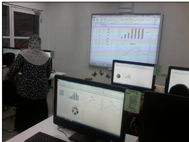
Gambar 3 – Peserta sedang tekun menyiapkan latihan graf menggunakan aplikasi Microsoft excel

Make sure to match photos with caption Pastika n gambar sepada n dengan keterangan