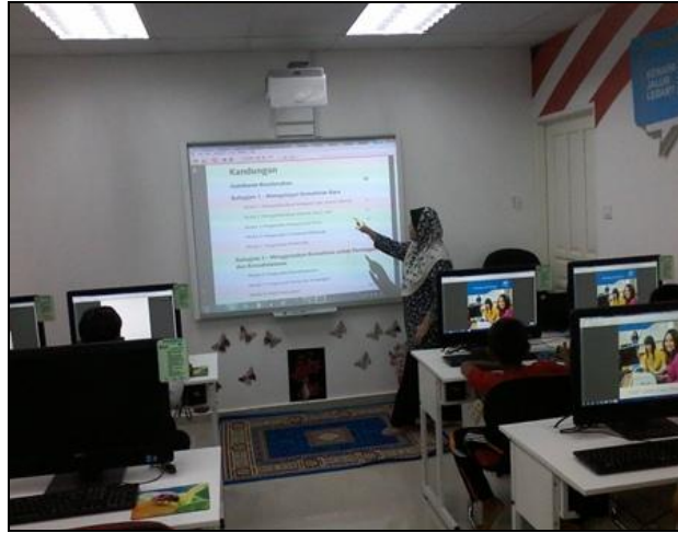
Gambar 1- Petugas sedang memberi penerangan berkaitan modul Intel Easy Steps