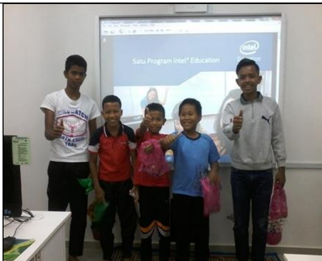
Gambar 6 - Peserta bergambar kenangan bersama sijil tamat latihan

Photo caption names Keterangan gambar berserta nama