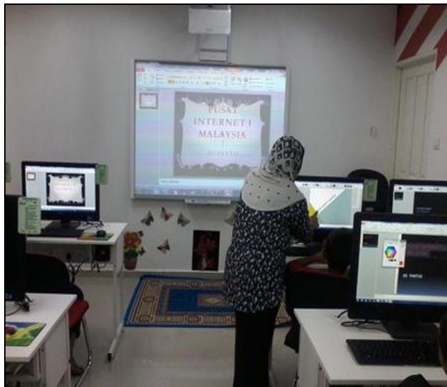
Gambar 4 – Peserta sedang tekun menyiapkan latihan menggunakan aplikasi Microsoft Power point