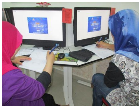
Gambar 4 – Peserta sedang tekun menyiapkan soalan kuiz