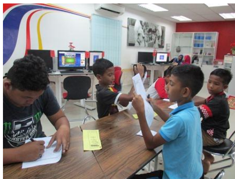
Gambar 3 – Peserta sedang tekun mendengar arahan bagi memulakan untuk membuat latihan kuiz