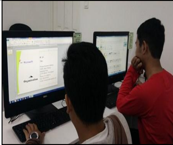
Gambar 7 – Peserta E-Basic sedang menyiapkan tugas menghasilkan Bisnes kad