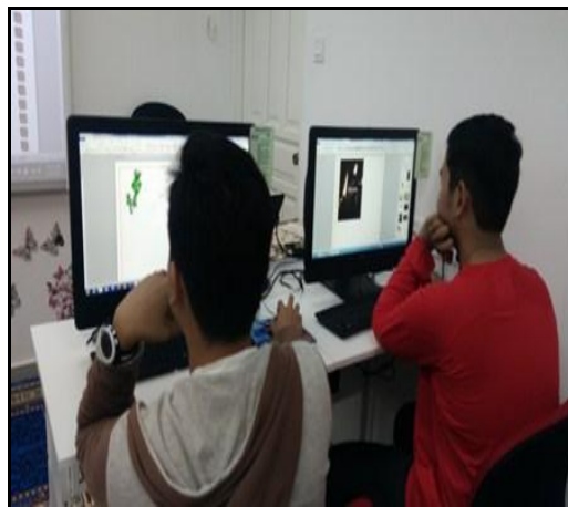
Gambar 3 – Peserta sedang tekun menyiapkan tugas Microsoft Word yang diberikan oleh petugas