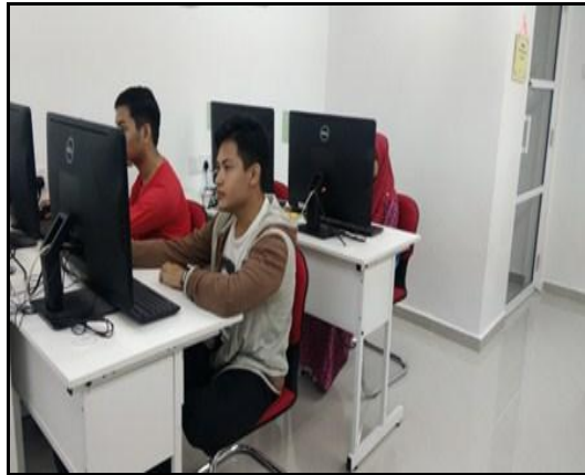
Gambar 2 - Petugas sedang menerangkan setiap perkakasan komputer dan fungsinya.