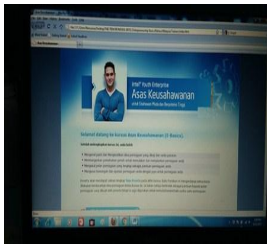
Gambar 6 – Petugas menerangkan modul E-basic kepada peserta