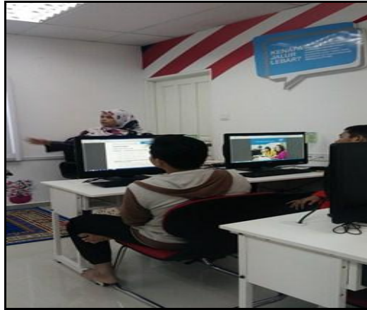
Gambar 1- Petugas sedang memberi penerangan berkaitan Modul Intel

photos with caption Pastika n gambar sepada n dengan keterangan