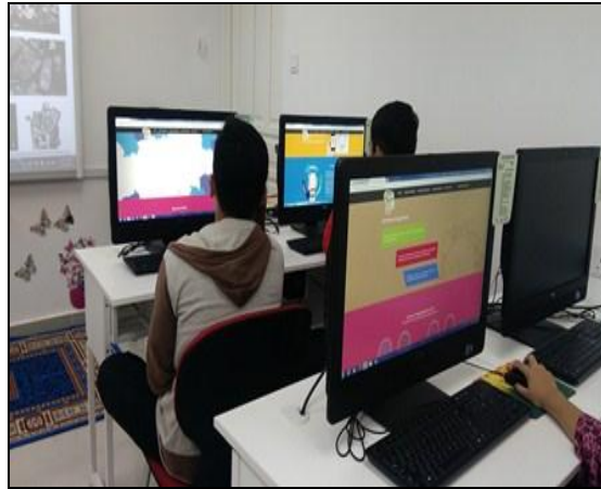
Gambar 1- Petugas tekun memberi penerangan tentang E-waste

caption Pastikan gambar sepadan dengan keterangan