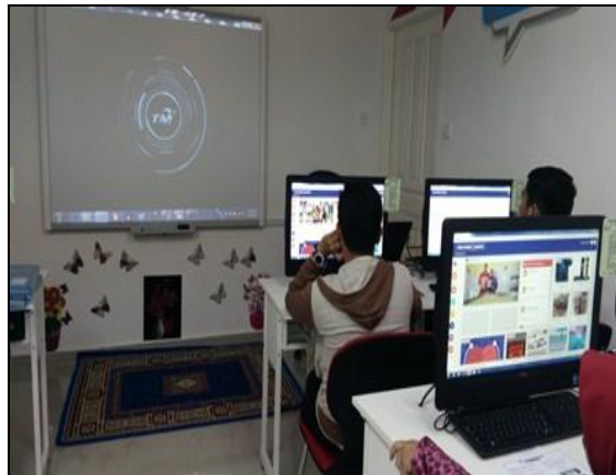
Gambar 2 - Pelajar sedang menonton montaj Dashboard Komuniti