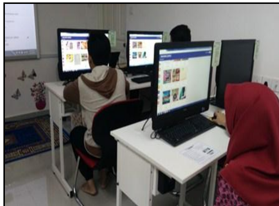
Gambar 3 – Peserta sedang melayari web Dashboard komuniti