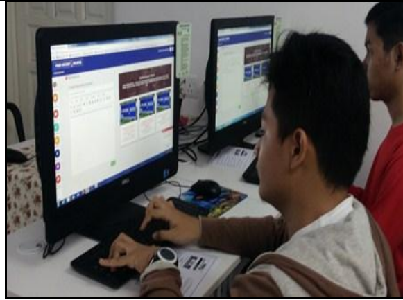
Gambar 4 – Peserta sedang membuat pengumuman di My Komuniti