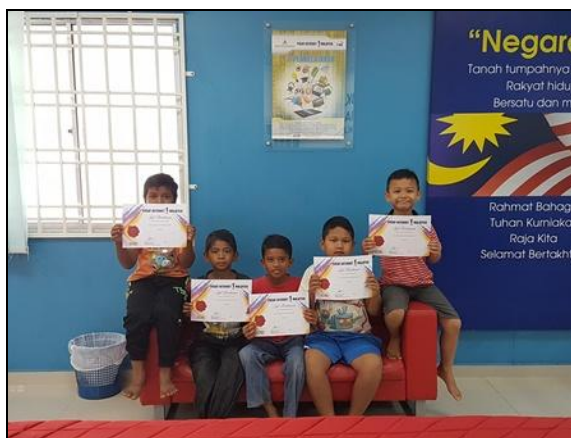
Gambar 5 – Peserta bergambar kenangan bersama sijil tamat latihan

Photo caption names Keterangan gambar berserta nama