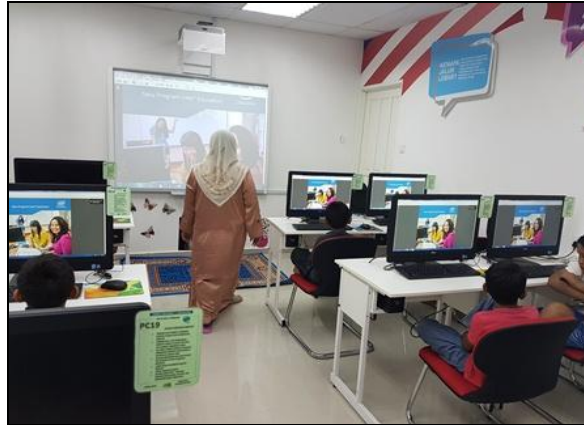
Gambar 1- Petugas sedang memberi penerangan berkaitan modul Intel Easy Steps