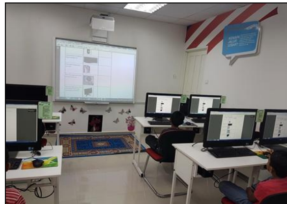
Gambar 2 - Pelajar sedang membuat latihan mengenal perkakasan komputer dan fungsi