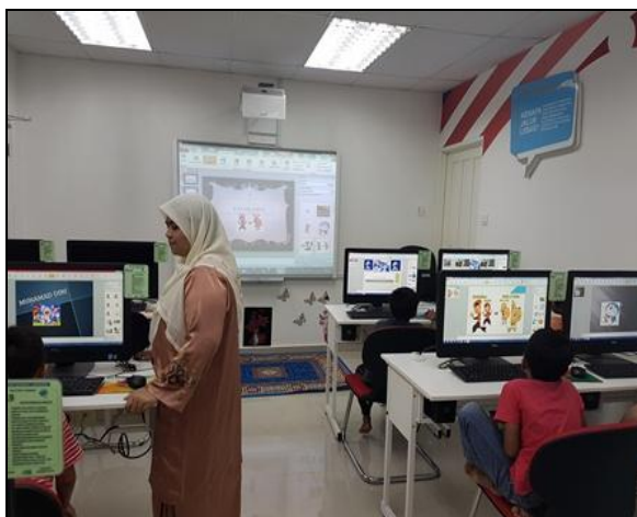
Gambar 4 – Petugas sedang memberi bimbingan kepada pelajar