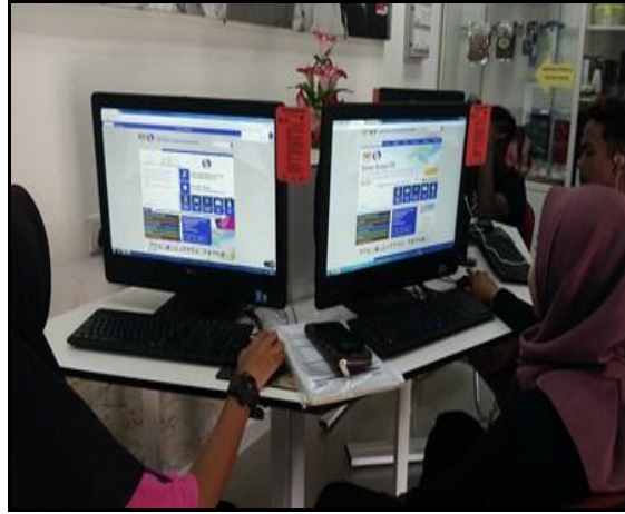
Gambar 1- Petugas sedang memberi penerangan tentang aplikasi SPA