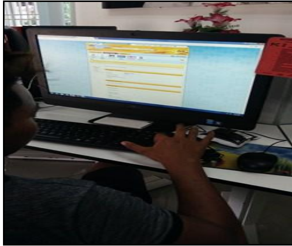
Gambar 4 – Petugas sedang tekun mengisi maklumat peribadi dan akademik di laman web Jobs Malaysia