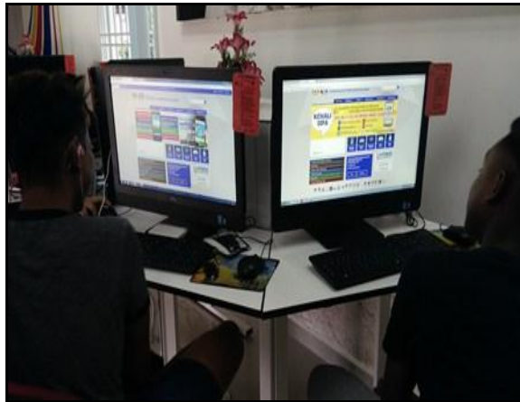
Gambar 2 - Pelajar sedang memulakan sesi pendaftaran secara online permohonan SPA