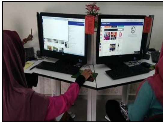
Gambar 2 - Pelajar sedang login aplikasi dashboard