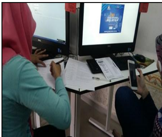
Gambar 4 – Pelajar sedang menjawab soalan kuiz