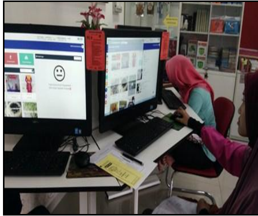
Gambar 1- Petugas sedang memberi penerangan