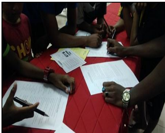
Gambar 4 – Soalan kuiz telah siap dijawab oleh pelawat dan ahli PIIM