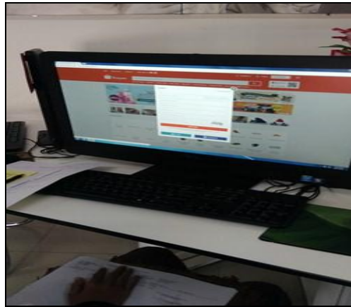
Gambar 1- Peserta sedang diberi bimbingan cara melayari laman web shopee