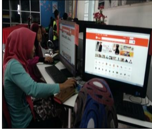
Gambar 4 – Petugas sedang membimbing peserta