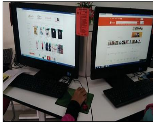
Gambar 2 - Peserta sedang mendaftar terlebih dahulu sebelum melakukan aktiviti pembelian