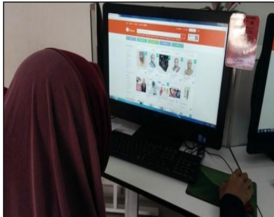
Gambar 5 – Peserta tekun explore aplikasi ini